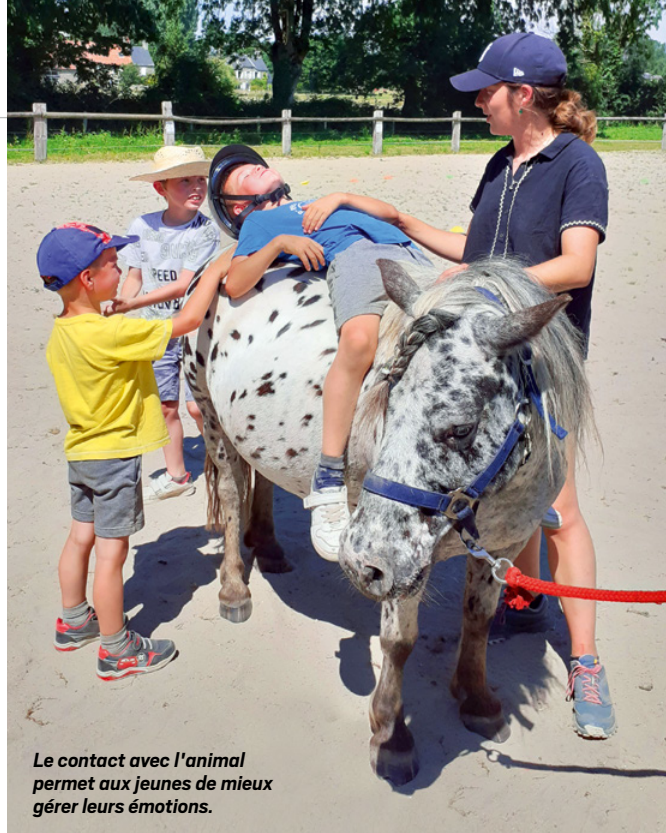
Le contact avec l'animal permet aux jeunes de mieux gérer leurs émotions.

Nous essayons de diversifier nos propositions pour répondre au mieux aux attentes et besoins des jeunes enfants et de leurs parents. Que ce soit les séances bébé lecteur ou de massage bébé, ces moments sont l'occasion de créer des espaces d'échanges, et tout particulièrement entre les parents. Cela favorise le partage d'expérience entre pairs, ce qui est toujours bénéfique. Sur notre territoire, nous proposons aussi, avec l'ARS (Agence régionale de santé) et la communauté d'agglomération Mont