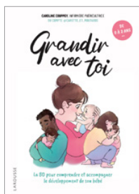
Grandir avec toi Éditions Larousse (Janvier 2024)