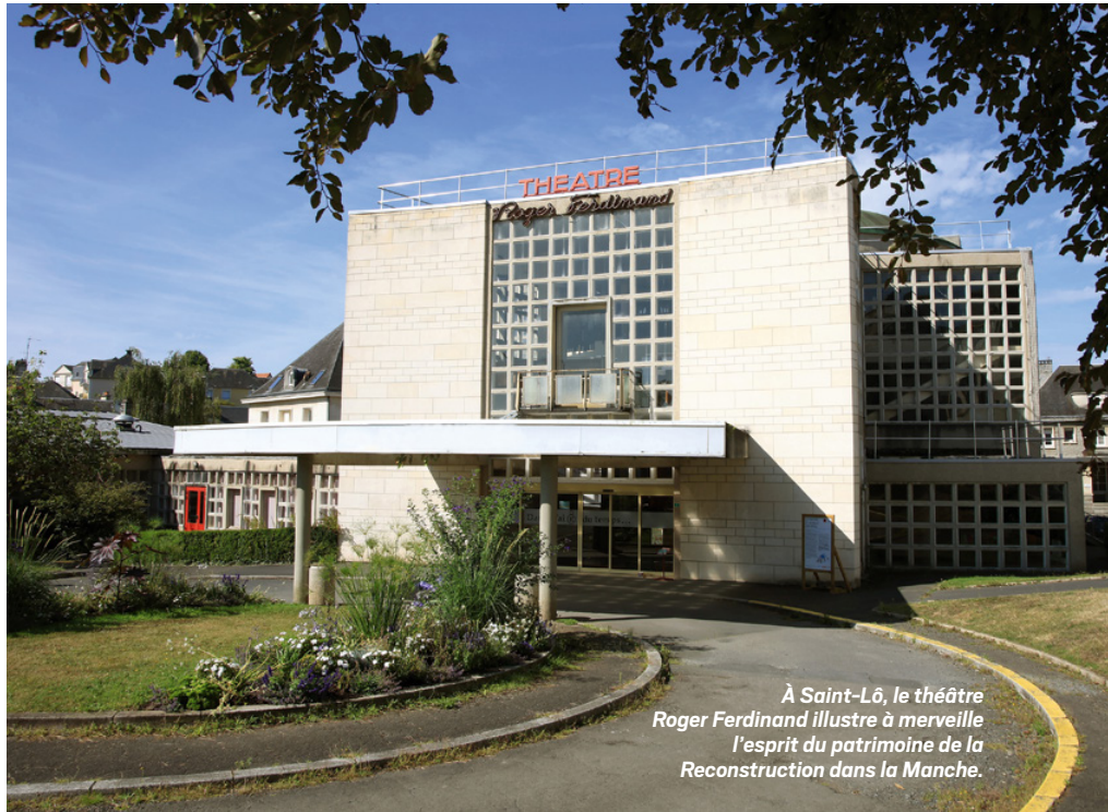
À Saint-Lô, le théâtre Roger Ferdinand illustre à merveille l'esprit du patrimoine de la Reconstruction dans la Manche.

Détruite à 91 % durant la Seconde Guerre mondiale, Saint-Lô a subi de plein fouet les destructions. Dès l'après-guerre, la ville devient un vaste chantier. Plusieurs bâtiments symbolisent ce renouveau, à l'image du théâtre, de l'hôtel de ville ou encore du beffroi, qui trône au milieu de la place centrale. Le musée d'art et d'histoire consacre une partie de ses espaces à cette période historique, avec une reconstitution fidèle de l'intérieur d'un appartement des années 1960.